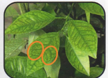
Nutritional Deficiency Deficiencias nutricionales